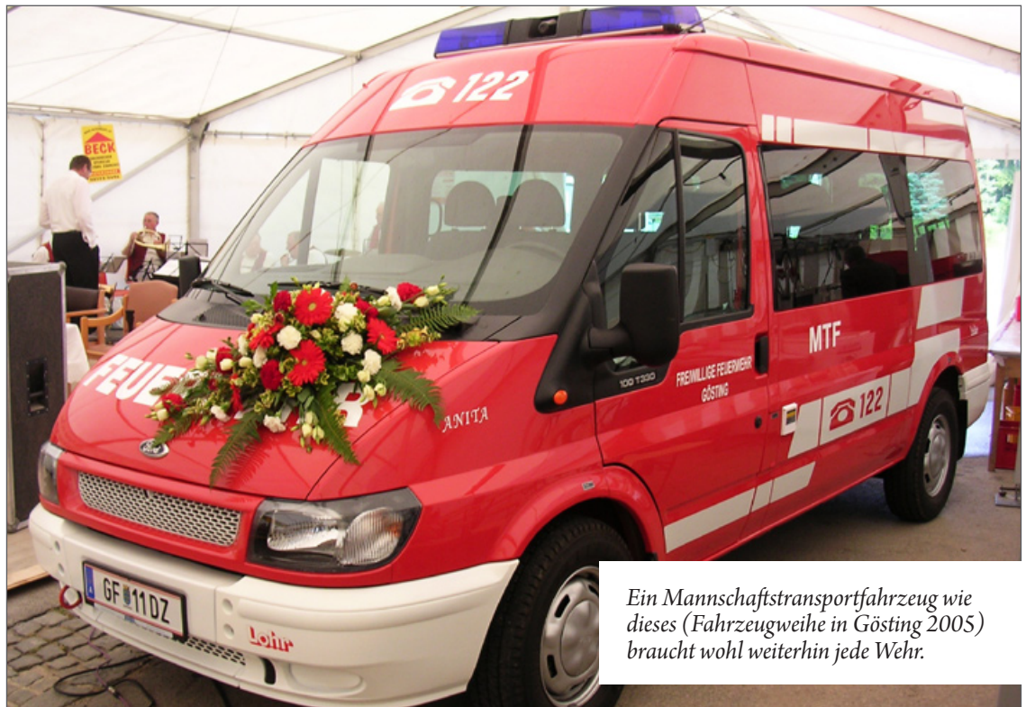
Ein Mannschaftstransportfahrzeug wie dieses (Fahrzeugweihe in Gösting 2005) braucht wohl weiterhin jede Wehr.

Das soll zu geringeren Kosten beim Ankauf führen, weil landesweit gleiche Fahrzeugtypen angekauft werden. Im Falle des Einsatzes mehrerer Wehren erleichtert ein einheitlicher Fuhrpark die Hilfeleistung der Freiwilligen, weil auch das Fahrzeug der Nachbarwehr am Einsatzort kein »unbekanntes Wesen« ist.