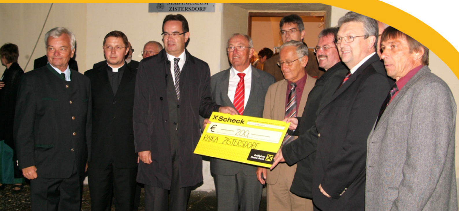
Wiedereröffnung des Stadtmuseums durch Landesrat Karl Wilfing

Eine weitere Verbesserung der medizinischen Versorgung wird es voraussichtlich noch im Winter geben. In der Kaiserstraße werden die Vorbereitungen für die Ordination eines Urologen getroffen Seite 5