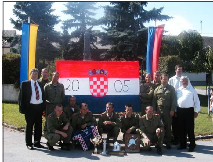
Die müden, aber überglücklichen Wehrmänner wurden mit Musik empfangen. Gruppenbild der Wettkampfgruppe Eichhorn 1 nach der Rückkehr von den Leistungsbewerben in der Landeshauptstadt

Für jene Feuerwehrgruppen, die bei den jährlichen Landesbewerben ständig Spitzenergebnisse erzielen, ist das Traumziel die Teilnahme an den Internationalen Wettkämpfen. Gewertet wurden die Ergebnisse der Landesbewerben 2002 bis 2004 (in Melk, Zistersdorf und St. Pölten) im Bewerb A und B (Altersklasse).